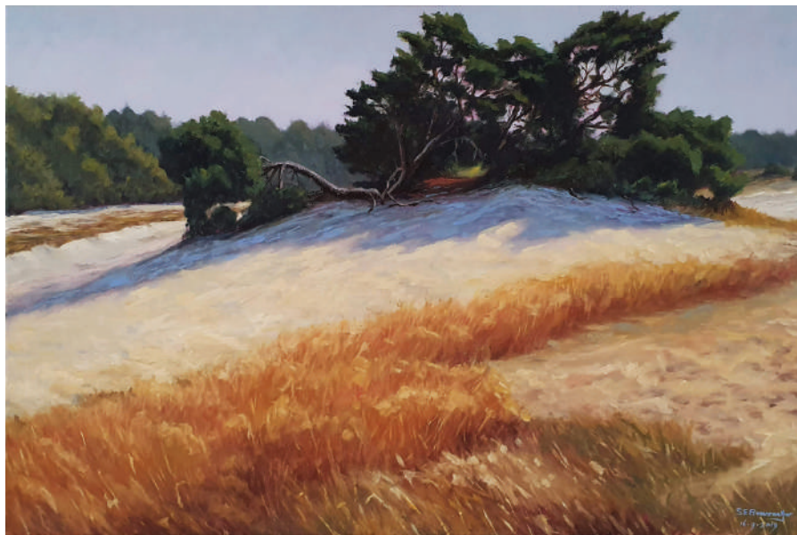
Een studiewerk op basis van een en-plein-air schets op het Kootwijker Zand. Olieverf op linnen, 60 x 90 cm

Meer weten van onze schilder? Ga naar https://manuelboonzaaijer.com/