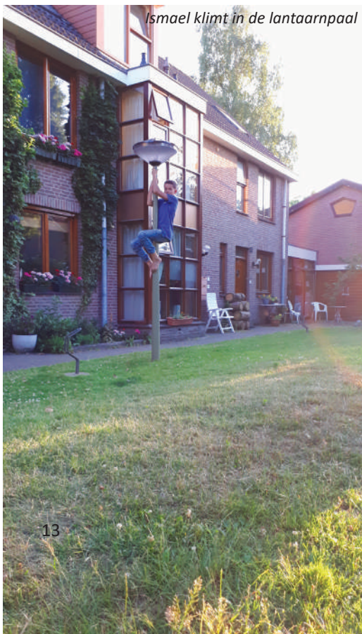
Ismael klimt in de lantaarnpaal