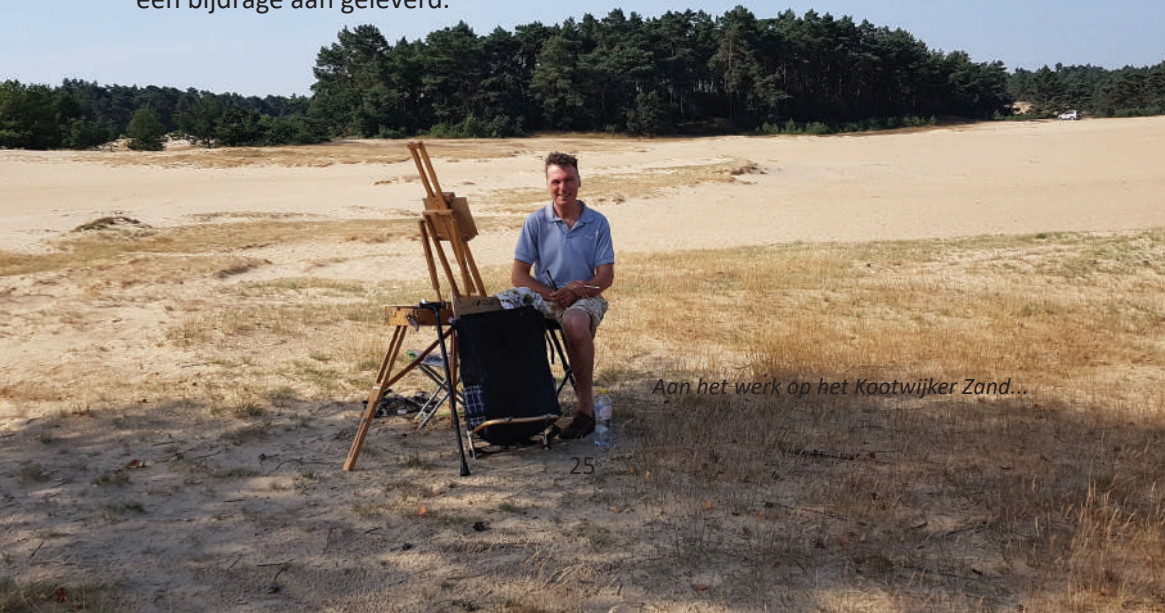
Aan het werk op het Kootwijker Zand...

Veel publiek, veel leuke gesprekken en een hoop nieuwe contacten erbij. En begin november heb ik een van mijn schilderijen ("Speelgoed van mijn dochter") gedoneerd aan de kunstveiling ten bate van Kinderhospice Binnenveld, in Barneveld. Er waren tal van werken. Het mijne leverde €300 op. Toch leuk. Die avond was goed voor €10.450, waarvan er geen cent aan de strijkstok bleef hangen. De Bondgenoot heeft die avond daar ook een bijdrage aan geleverd.