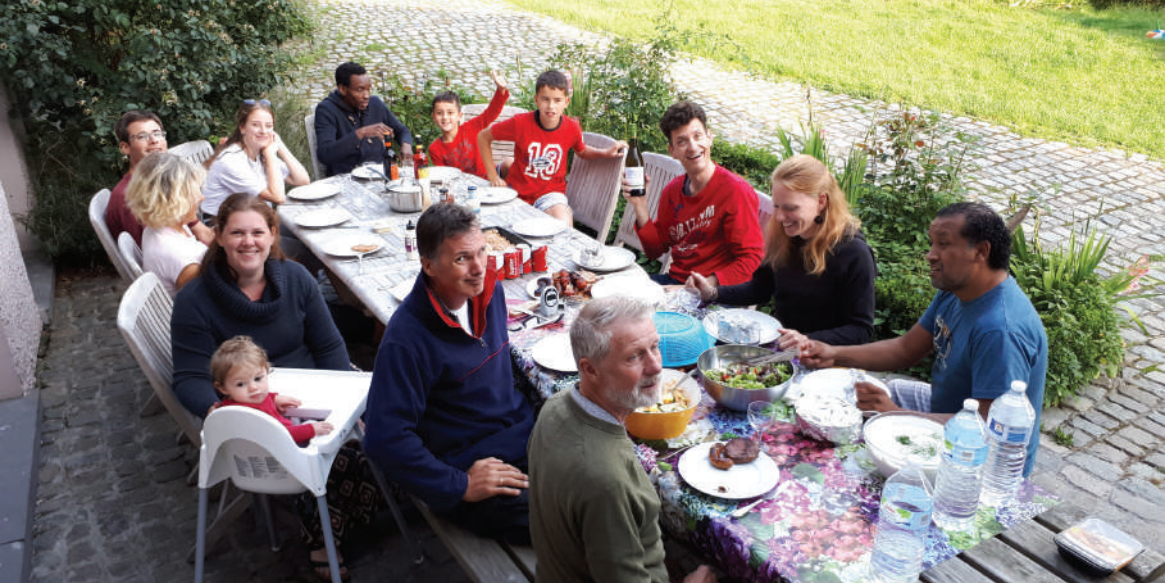
Eén van de vele feestelijke maaltijden op ons vakantie-adres...