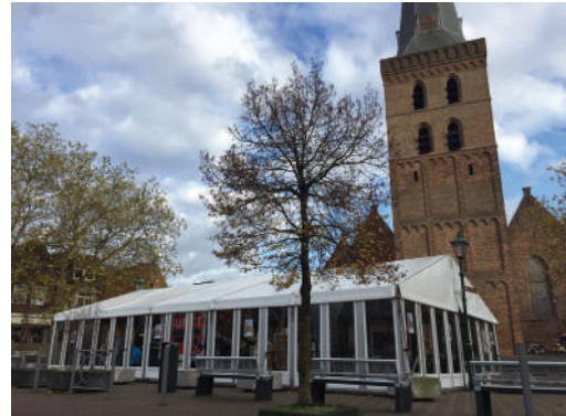
De tent op het Torenplein te Barneveld

Ikzelf ben die week elke dag in de tent aanwezig geweest en heb drie schilderijen (waarvan één alweer is verkocht) en vier portretten in houtskool gemaakt. Er was een goede sfeer en allemaal waren we bijzonder gemotiveerd er ook iets moois van te maken – zowel qua evenement, als in ons eigen werk. Volgend jaar weer!