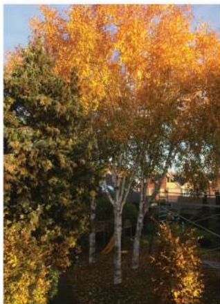
De drie berken die in de tuin van de Bondgenoot staan, kleuren alles goud...