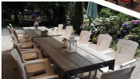
Twee tafels van 200 x 83 cm... ruimte genoeg!