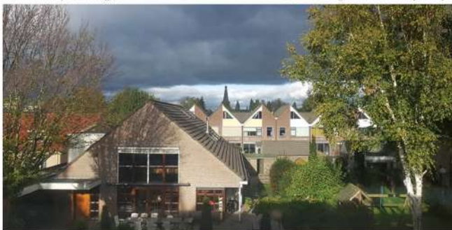
Uitzicht op het Grote Huis en de binnentuin