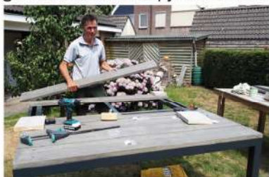
Het monteren van de steigerplanken