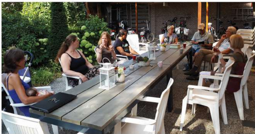
Gezellig op het terras van het Grote Huis, op een warme zomerdag...