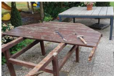
De sloop van de oude tafels - één van de nieuwe staat al op z'n plek

Ik was blij dat ik groen licht kreeg voor het ontwerpen van nieuwe tafels. Het voelde als iets natuurlijks; ik had destijds veel aandacht besteed aan de oude set, en dat ze nu echt hadden afgedaan ging me dan ook wel een beetje aan het hart. Zomaar kant en klaar nieuwe kopen had gekund, maar was lang niet zo