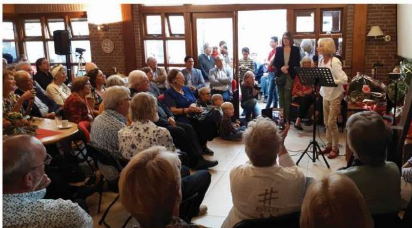
Het Grote Huis barstte bijna uit zijn voegen, zoveel mensen... Op de foto niet te zien, maar rondom op het buitenterras stonden grote tenten tegen het gebouw. Ook daar stond het vol.