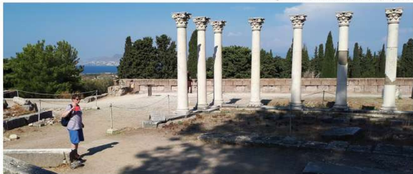
Margriet tussen de oude ruïnes op Kos