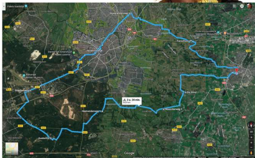
De gereden route (bij benadering...)