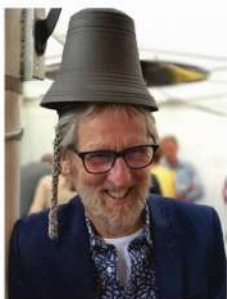
Bertus heeft de klok horen luiden, én weet ook waar de klepel hangt!