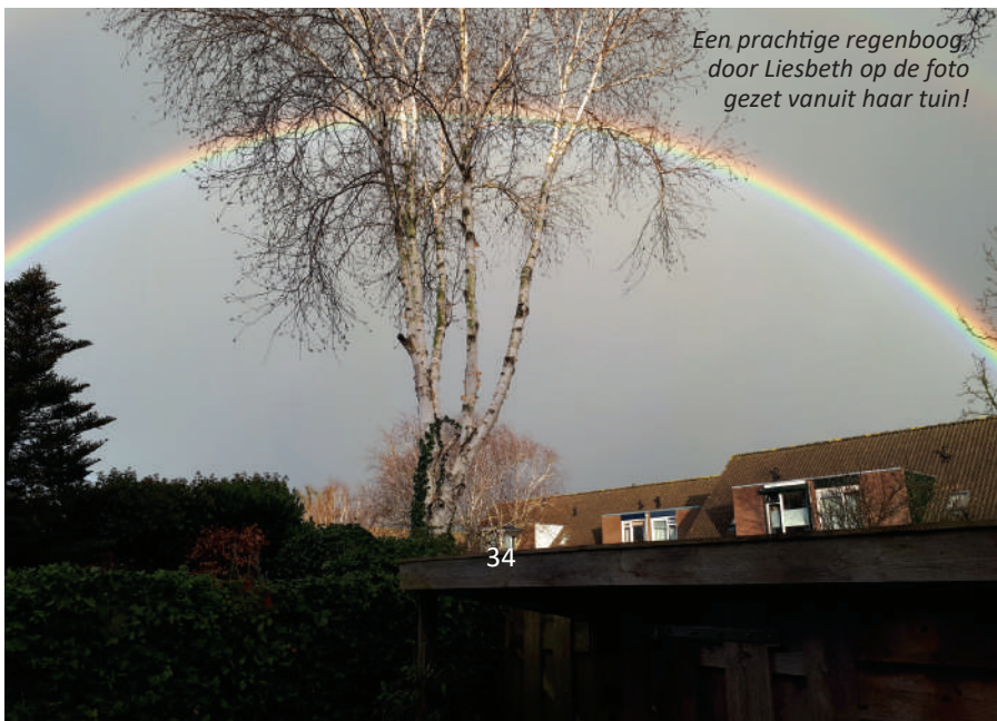
Een prachtige regenboog, door Liesbeth op de foto gezet vanuit haar tuin!