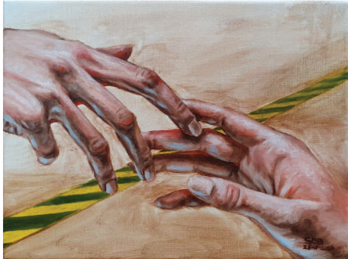
"Handreiking (in tijden van corona)", olieverf op linnen, 30 x 40 cm