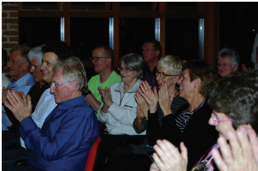
Een deel van het (erg enthousiaste) publiek