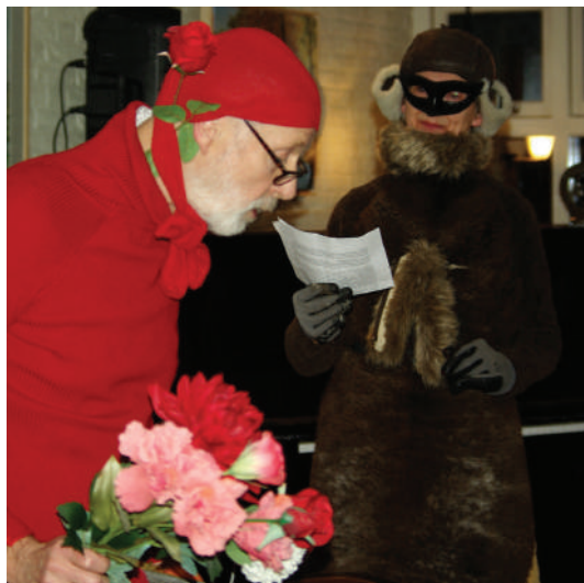
Roodkapje en de Wolf